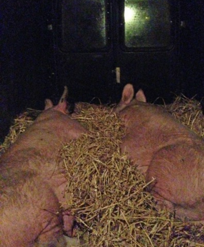
Granny & Muk tijdens het VIPS Vervoer naar Het Beloofde Varkensland. Very Important Pigs. Dik in het stro onder een solarium. Het was 30 december 2015.