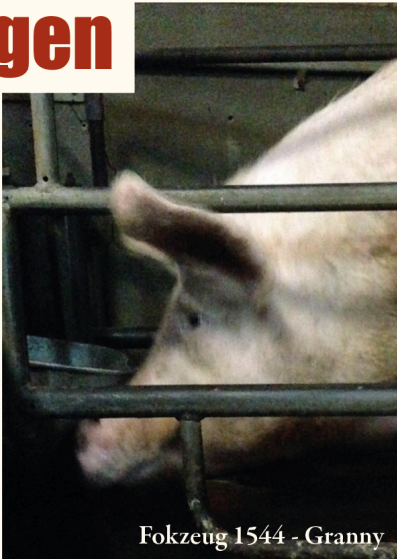
Fokzeug 1544 - Granny