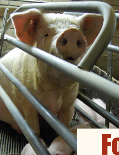
Fokzeug 1281 - La Mama