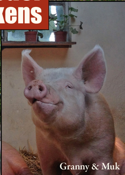
Granny & Muk