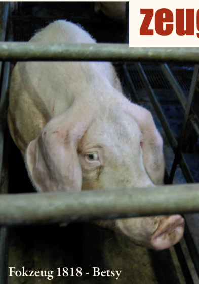
Fokzeug 1818 - Betsy