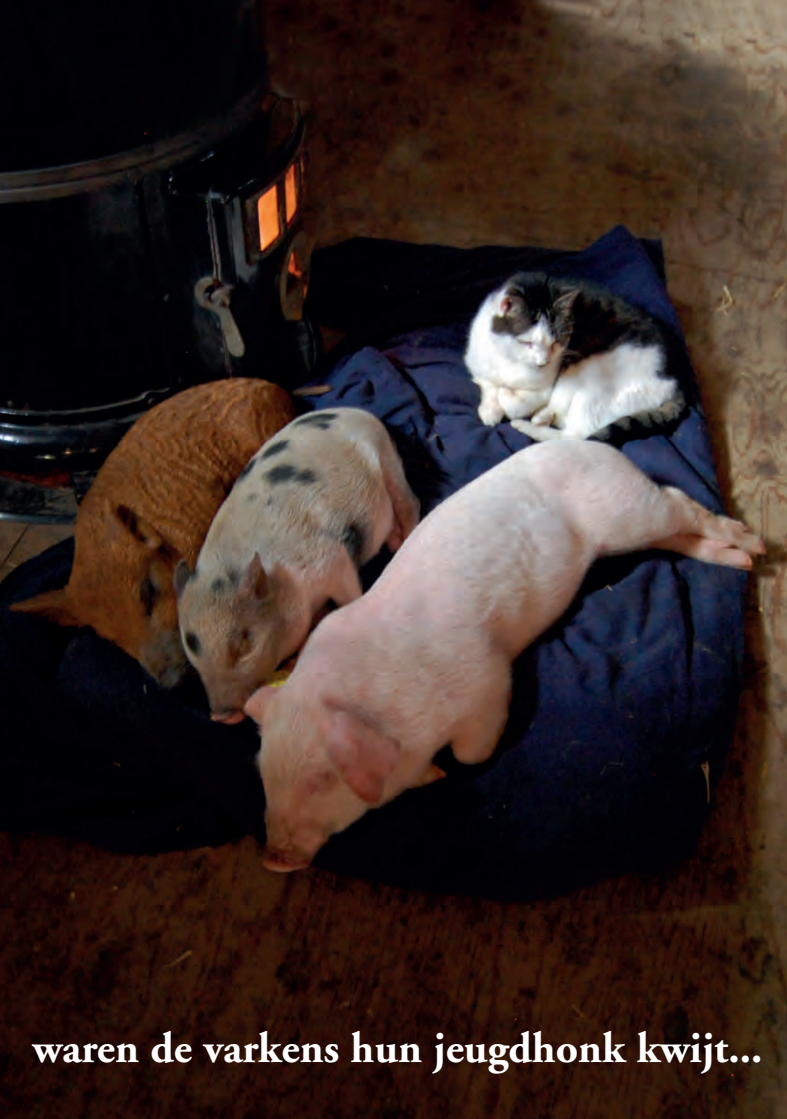
waren de varkens hun jeugdhonk kwijt...