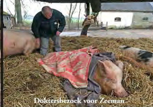
Doltersbezoek voor Zeeman