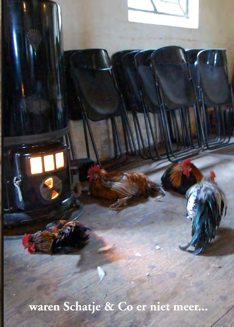
waren Schatje & Co er niet meer...