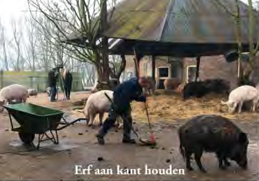
Erf aan kant houden