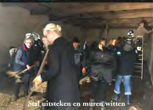
Stal uitsteken en muren witten